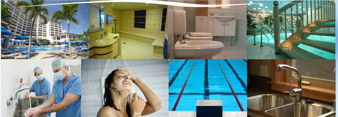
SSU 3 RAIN